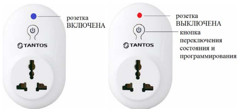
Рисунок 1. Беспроводная розетка